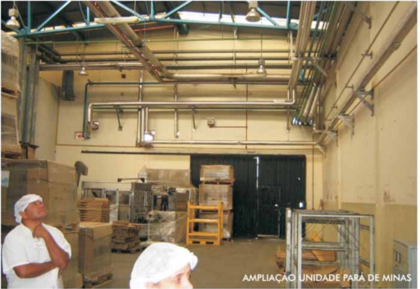
AMPLIAÇÃO UNIDADE PARÁ DE MINAS