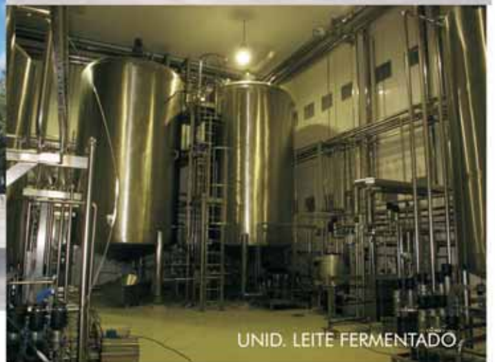
UNID. LEITE FERMENTADO