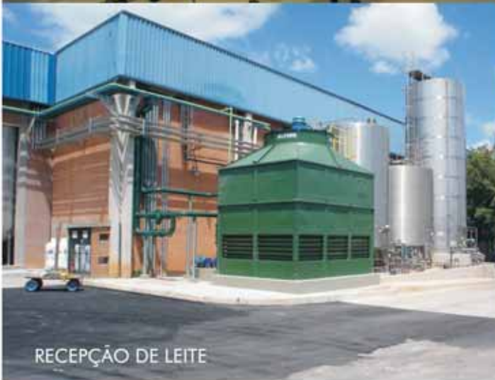
RECEPÇÃO DE LEITE