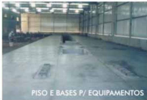
PISO E BASES P/ EQUIPAMENTOS