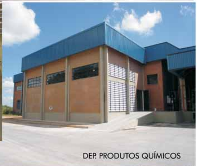
DEP. PRODUTOS QUÍMICOS