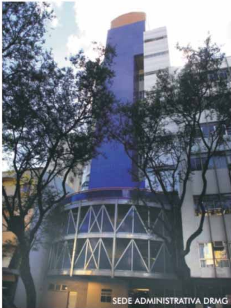
SEDE ADMINISTRATIVA DRMG