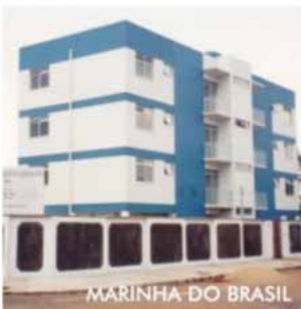
MARINHA DO BRASIL